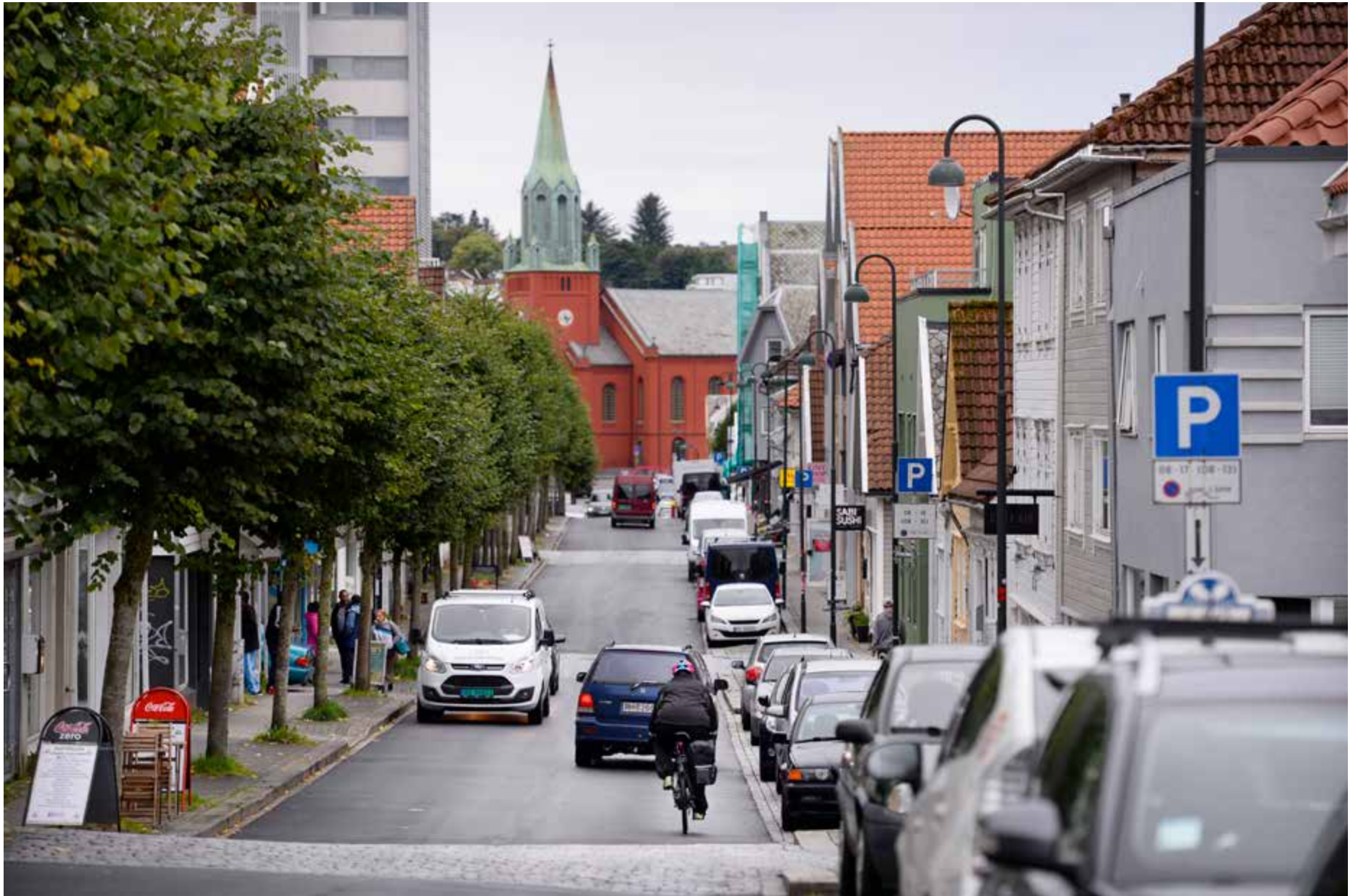
Aftenbladet støtter forslaget om et prøveprosjekt med enveiskjøring i Pedersgata i Stavanger sentrum.

Grunnlagt 1. september 1893 av Lars Oftedal